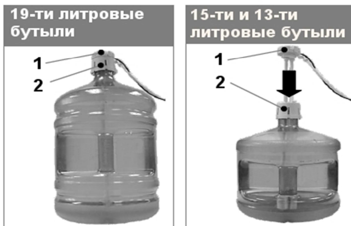
Рис.2 Установка сифона на бутылки с водой